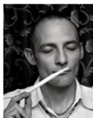
Perfumer Christophe Laudamiel クリストフ・ラウダミエル

スイスの世界最高峰フレグランスストップメーカーと世界的に有名な天才調香師が共同で作上げた、上品かつ特別な香りを取り揃えています。